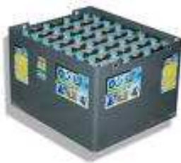
Batteria per trazione

Restano da determinare il numero di elementi e la loro capacità. Per la determinazione di questi due parametri sono necessarie alcune considerazioni a priori che svolgeremo nel seguito.