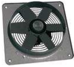
Ventola di estrazione