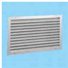
tipico griglia di ventilazione

Per quanto riguarda la disposizione e la tipologia delle aperture di ventilazione rimandiamo a quanto indicato sulla guida relativa alla ventilazione naturale dei gruppi elettrogeni in quanto valgono le stesse considerazioni ( http://www.progettazione-impianti-elettrici.it/ventilazione-naturale-del-locale.php )